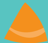
Gwersyll yr Urdd Caerdydd