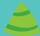
Gwersyll yr Urdd Glan-llyn