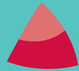
Canolfan yr Urdd Pentre Ifan