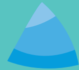
Gwersyll yr Urdd Llangrannog