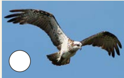
d) Gwalch y Pysgod