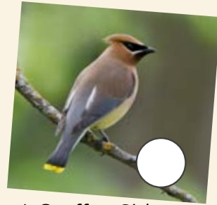
c) Cynffon Sidan