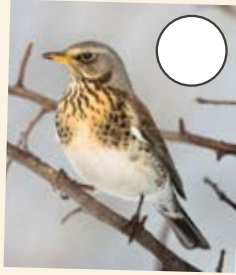
b) Socan Eira