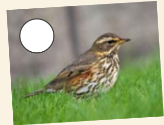
dd) Coch yr Adain

4. Gan ddechrau ar y seren sydd ar y grid, symud fel hyn, gan dynnu llun seren arall bob tro rwyd ti'n disgyn ar sgwâr: